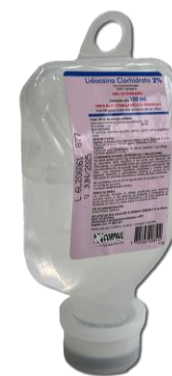
LIDOCAÍNA HCL 2 % X 100 ML