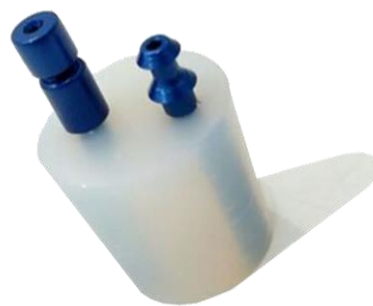
TAPON DE SILICONA PARA OPU. MARCA: TED