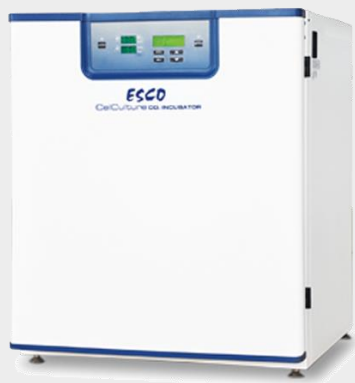
INCUBADORA CELCULTURE 170L SENSOR IR, CONTRO DE CO2 MARCA: ESCO