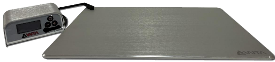
PLATINA TERMICA COMPACTA. MARCA: WTA