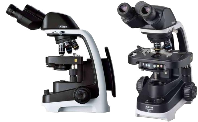
MICROSCOPIO BINOCULAR - ECLIPSE Ei MARCA: NIKON