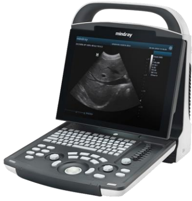
ECÓGRAFO PORTÁTIL DP 10. MARCA: MINDRAY.