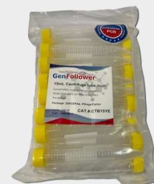
TUBO CÓNICO DE 15 ML, TAPA ROSCA ESTÉRIL