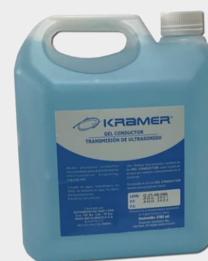
JALEA CONDUCTIVA (GEL ULTRASONICO) GALON X 3785 ML AZUL. MARCA: KRAMER