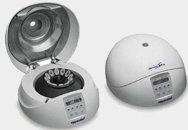
CENT. MINISPIN G, 12x2ML ROTOR, 120V EMC TW MARCA: EPPENDORF