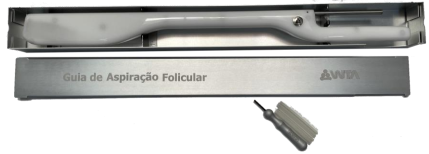
GUIA PARA OPU. MARCA: WTA