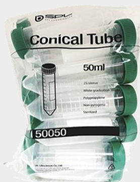
TUBO CONICO PLUG SEAL PP 50 ML ESTERIL BOLSA X 25 UNIDADES. MARCA: SPL