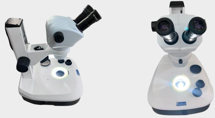
ESTÉREO MICROSCOPIO BINOCULAR B 10X 15X 20X OCULAR/ SOPORTE BSZ-F35 MARCA: BETSCOPE