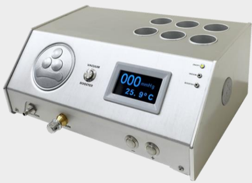
BOMBA DE VACÍO BOVINO. MARCA: WTA