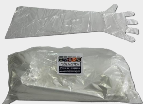
MANGA DESECHABLE SUPER SENSITIVA CAJA X 100 UND