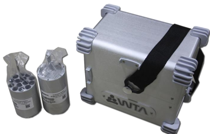
TRANSPORTADORA DE EMBRIONES Y OOCITOS. MARCA: WTA