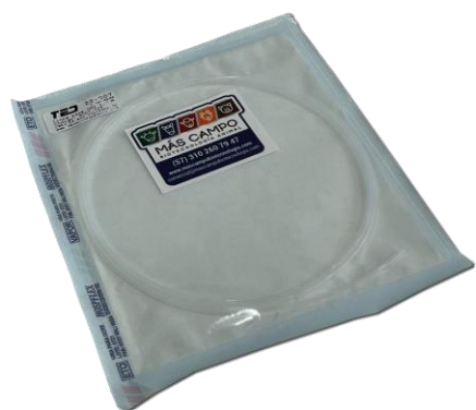
LINEA PARA OPU 1.20 METROS. MARCA: TED