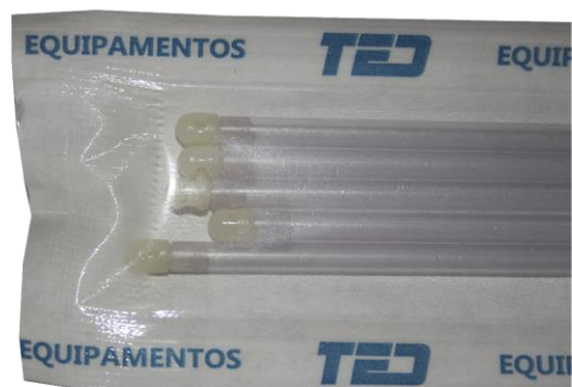
FUNDAS PARA TRANSFERENCIA DE EMBRIONES. MARCA: TED