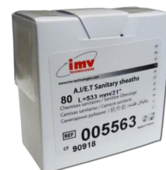
CAMISA SANITARIA ROLLO X 80/ MARCA: IMV